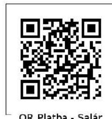
QR Platba - Salár

splátkách farnímu sboru, do něhož člen patří.