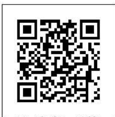
QR Platba - Salár