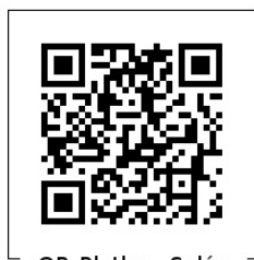
QR Platba - Salár

Zavedení trvalého příkazu usnadňuje plánování hospodaření. Jako variabilní symbol uvádějte své osobní číslo (je u Vaší adresy na sborových dopisech, v seznamech plátců, nebo se ho dozvíte ve farní kanceláři). Jako specifický symbol: