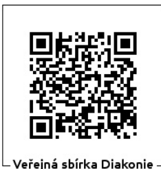
Veřejná sbírka Diakonie

„Dávejte podle toho, co máte, vždyť to, co se počítá, je ochota.“ 2. Korintským 8, 11-12